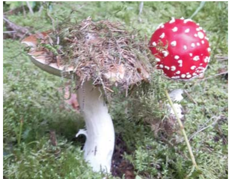
Ina Komarova miške pamatė tokią draugystę...