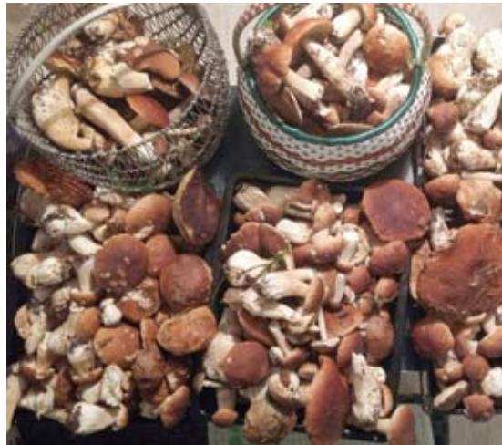
Žerutė Vaškevičiūtė Semaškienė tokių laimikį aptiko lapuočių miškuose netoli Vaižganto tėviškės.