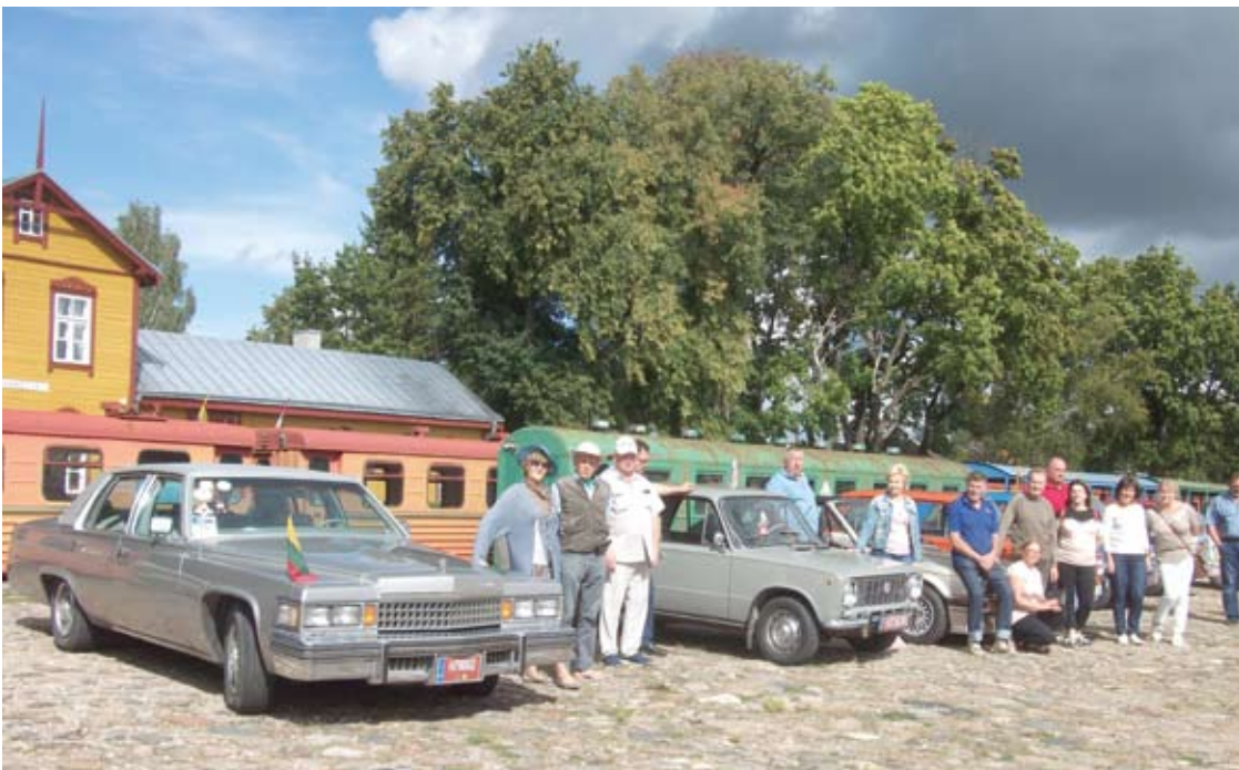
Automobilių paradas istorinėje aikštėje.