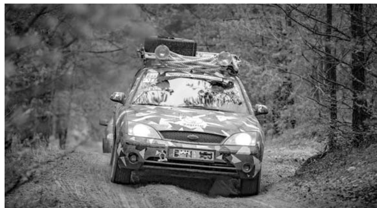
„Žiurkių“ lenktynėsi dalyvavo ir keli anykštėnų ekipažai. Vieną jų sudarė tik moterys.

Šių metų sausio pabaigoje portalas 15 min.lt rašė, kad dėl „Žiurkių lenktynių“ dalyvių sugadintų keliukų skundėsi Švenčionių, Vilniaus ir Utenos rajonų gyventojai. Tuomet varžybų organizatoriai pažadėjo sugadintus keliukus suremontuoti.