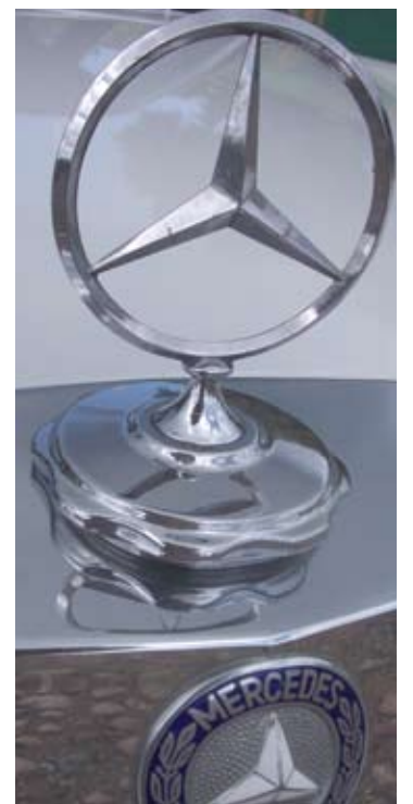
Prabagiai spindi „Mercedeso“ ženklas...

Suvalkiečiai viešnagę Anykščių krašte baigė stabtelėjimu Kavarske. Apžiūrėjo bažnyčią, pasigėrė šv. Jono šaltiniu bei, kaip senienų mėgėjams ir dera, pasistiprino senoviniu būdu pagamintais koldūnais.