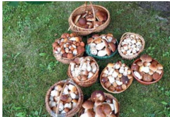
Olga Paškevičienė gausybę grybų rado Traupio miškuose.