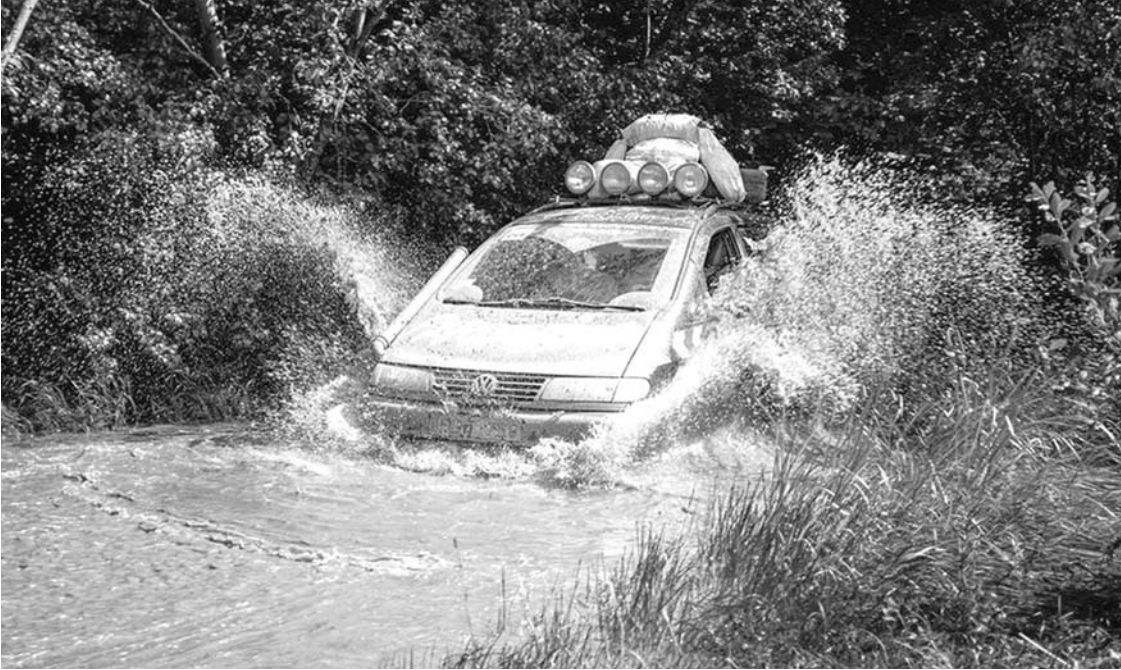
Lenktynių trasos driekėsi ir keliais, ir bekelėmis...